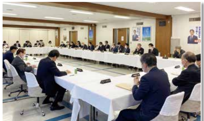
4月20日 自由民主党総務会

財務金融部会長として「新型コロナウイルス感染症等の影響に対応するための国税関係法律の臨時特例に関する法律案」について説明致しました。