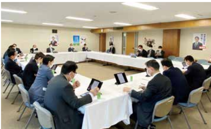
4月20日 自由民主党政調審議会

財務金融部会長として「新型コロナウイルス感染症等の影響に対応するための国税関係法律の臨時特例に関する法律案」について説明致しました。