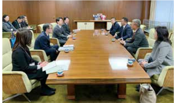
令和2年2月12日(水) 北海道庁 鈴木直道知事との面談及び意見交換