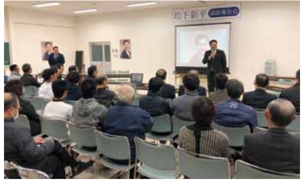
令和2年2月22日(土) 田野地区国政報告会