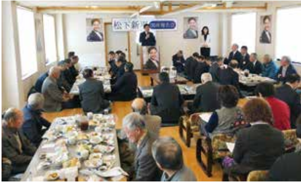
令和2年2月2日(日) えびの地区国政報告会