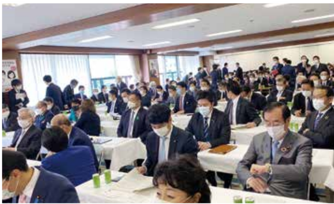
4月17日 自由民主党政務調査会全体会議 「経済対策について」財務金融部会長として出席致しました。

緊急事態宣言そのものは、総理大臣が発令しますが、実際に協力を求めるのは、都道府県の知事です。住民の外出自粛要請や施設の使用制限や停止の要請などをするようになります。