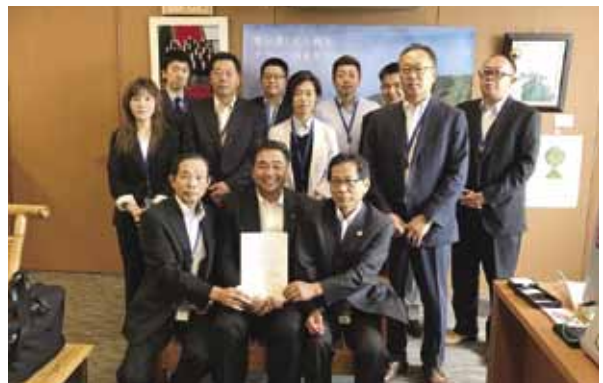
6月14日 みやざき養豚生産者協会による要望活動