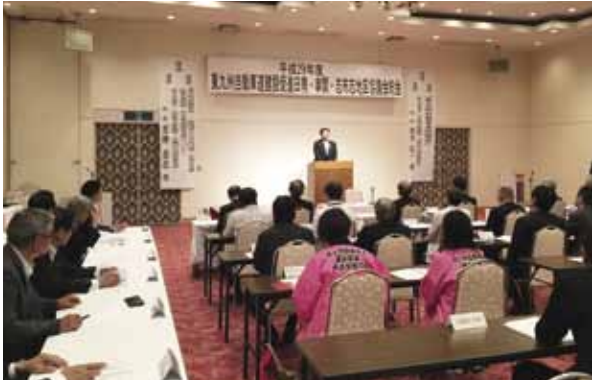
6月2日 東九州自動車道建設促進日南・串間・志布志地区協議会総会