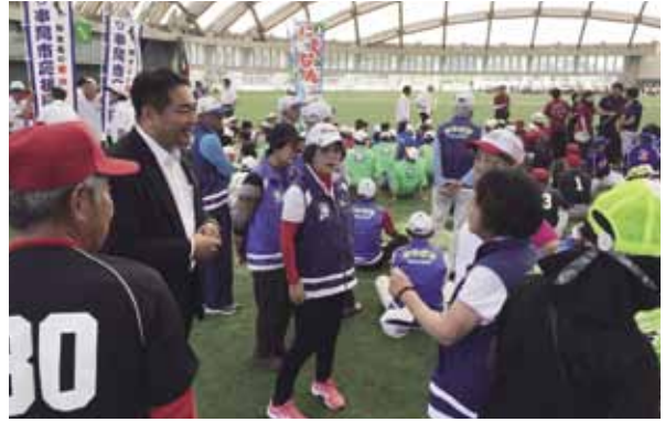
6月3日 みやざき県民総合スポーツ祭