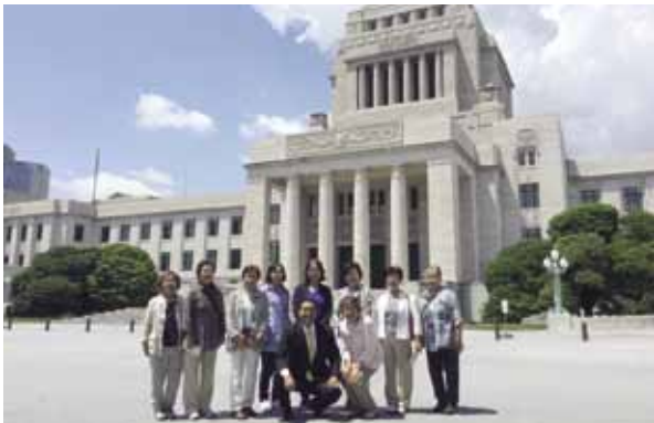
6月5日 宮崎県グランドゴルフ協会女性部 国会見学